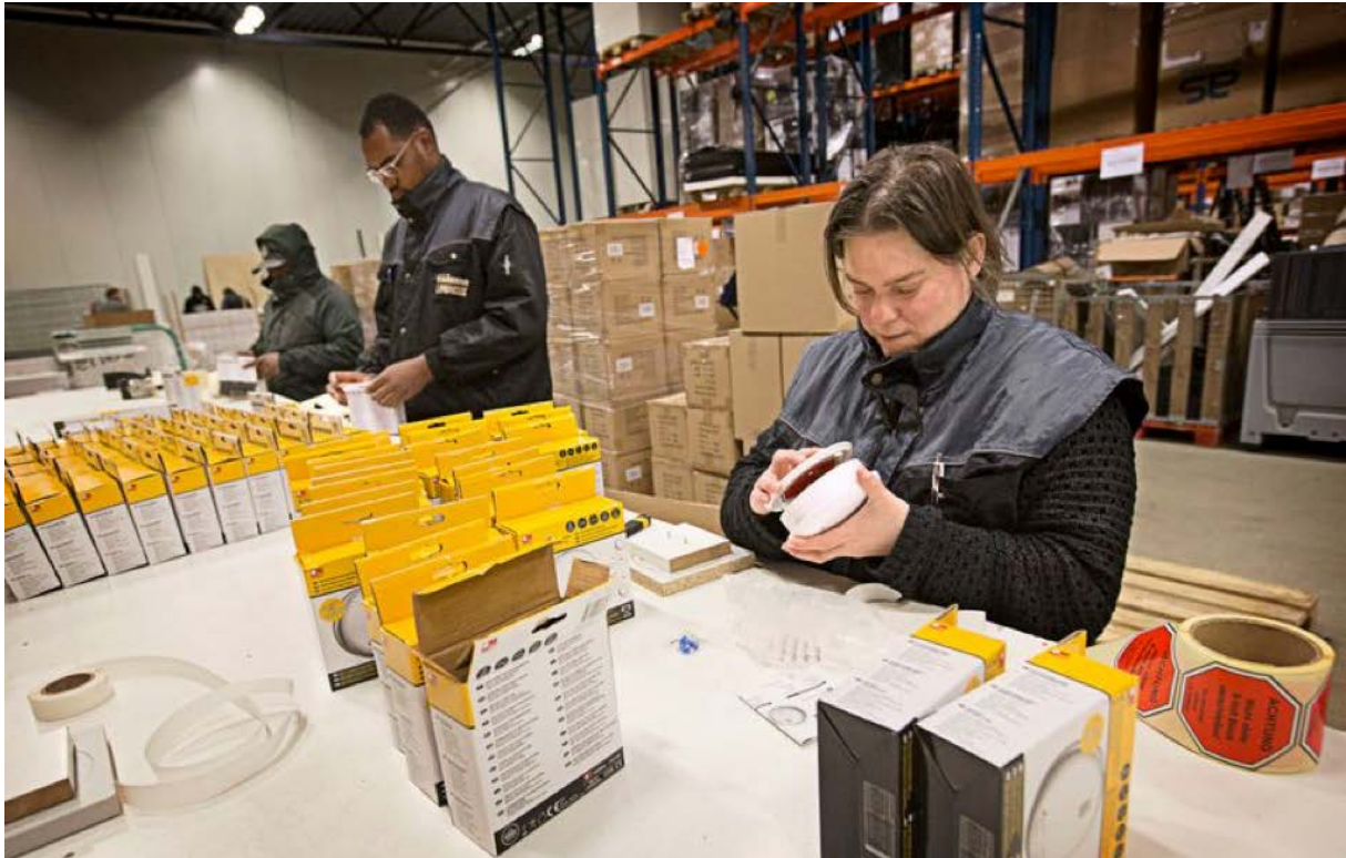
Werknemers plakken stickers op rookmelders in een magazijn, Tilburg.

www.volkskrant.nl/auteur/Trudie Knijn 10 januari 2021, 22:15