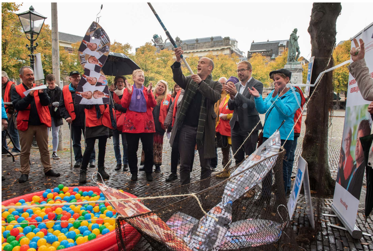
De echte grote fraudevisser-actie februari 2020.

Bij de intake van een cliënt waarschuwde de ambtenaar voor de strengheid van de gemeente. 'Bij het eerste gesprek werd je verteld wat jij allemaal moest doen om in aanmerking te komen voor een uitkering. Als jij je daaraan maar even niet zou houden, dan volgden direct sancties. De ambtenaar kwam trots met voorbeelden die de hardheid van de gemeente moesten onderstrepen.' Zelfs mantelzorg aan oma moest iemand verdedigen. Want 'iedereen heeft oma's', zo kreeg ze te verstaan. Deze verzuchting tot slot: 'Vroeger moest je ook alle gegevens overleggen, maar daarna (na invoeren Participatiewet) was de toon anders. Daarvóór ervoer ik meer begrip'.